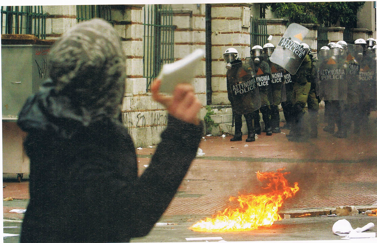
Manifestação contra as medidas de austeridade degenerou em confrontos violentos em Atenas

investidores só as compravam quando estas pagavam juros muito mais altos do que as obrigações consideradas como investimentos seguros, como as emitidas pela Alemanha. Contudo, à medida que o lançamento do euro se aproximava, o prémio de risco sobre as obrigações gregas desapareceu. Pensava-se que a dívida grega em breve ficaria imune aos perigos da inflação: o Banco Central Europeu tomara as medidas necessárias. Não era possível imaginar que um membro da nova união monetária pudesse ir à falência, pois não?