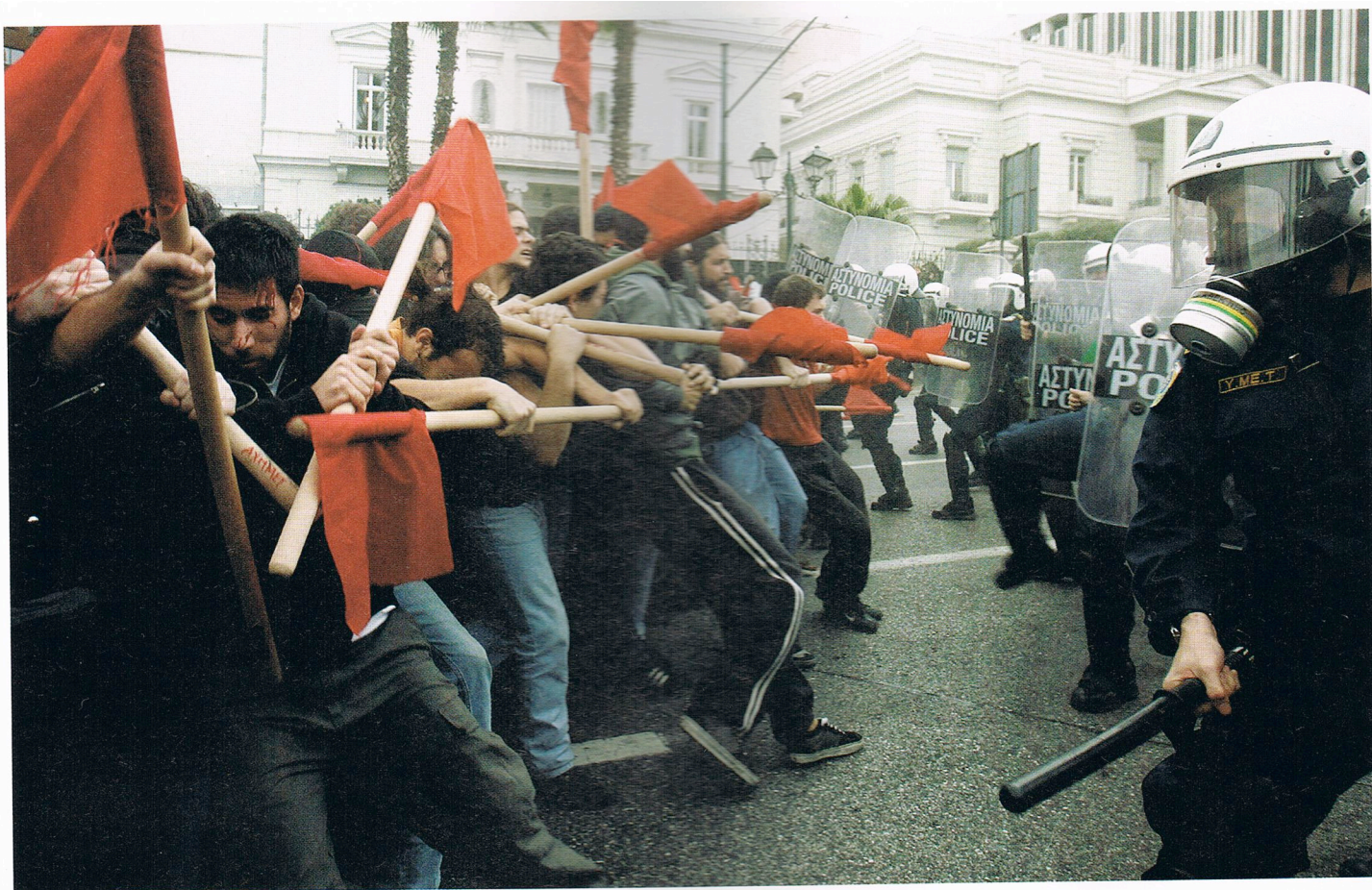
Confronto entre polícia de choque e manifestantes nas ruas de Atenas, em dezembro de 2010